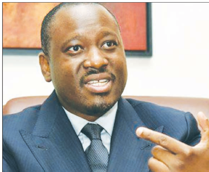
Guillaume Soro veut, comme toujours, manipuler l'opinion.