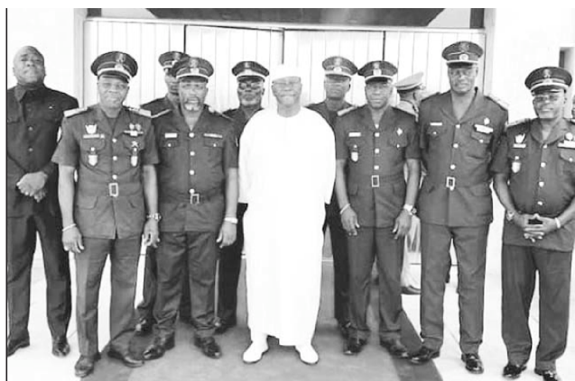
Le président de la République Alassane Ouattara (en boubou blanc) a longuement échangé avec les ex-com-zone.